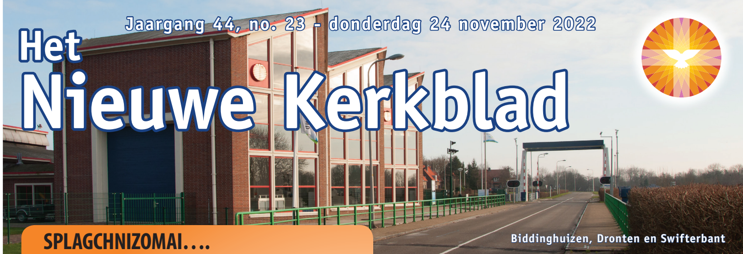
Biddinghuizen, Dronten en Swifterbant