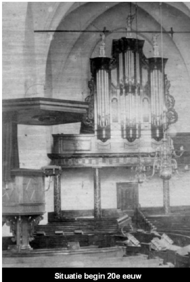
Situatie begin 20e eeuw

In 2004 werden de zijkanten van de pedaalkas en de onderkant van open rasterwerk voorzien overeenkomstig de voorkant, dit om de klankuitstraling te verbeteren.