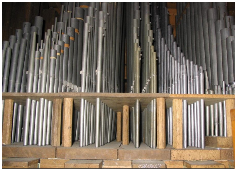
Bovenwerk: vlnr: Prestant 4, Roerfluit 8, Gamba 8, Salicionaal 4, Nasard 3, Woudfluit 2, Klarinet 8

Pedaalkas: blank gelakt eiken, zonder achterwand; in 1976 nieuw geplaatst tegen de torenwand. De voorkant en zijkanten zijn opengewerkt met rasters. Balustrade orgel met zijkantbespeling, ebbenhouten, zwarte registerknoppen met porseleinen plaatjes met zwart opschrift, in 1976 naar origineel opschrift vernieuwd. De manuaalregisters met vierkante trekkers bevinden zich in