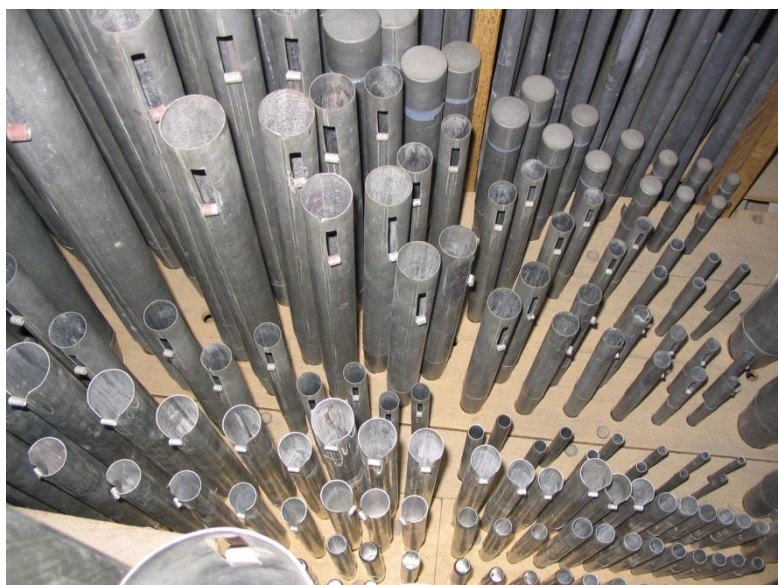
Hoofdwerk: vbnb: Holpijp 8, Octaaf 4, Fluit 4, Octaaf 2, Mixtuur

Na jarenlange discussies gaf de kerkvoogdij in 1975 opdracht aan de orgelbouwers Hendriksen