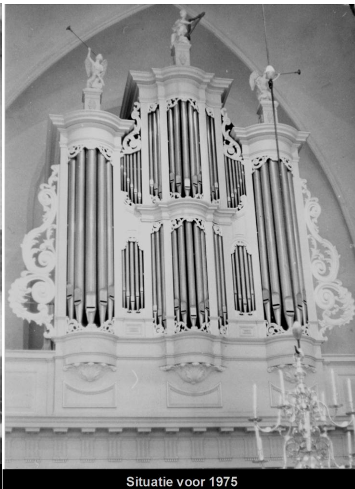
Situatie voor 1975