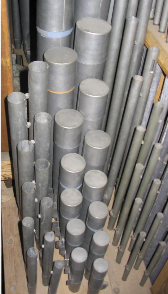
Hoofdwerk: vlnr: Prestant 8, Bourdon 16, Salicionaal 8