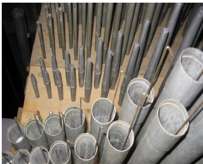
Bovenwerk: vbnb: Salicionaal 4, Nasard 3, Klarinet 8