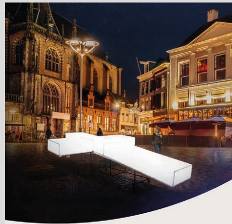
Vervolg op de volgende bladzijde

De Protestantse Kerk werkt samen met The Passion om het paasverhaal aan miljoenen Nederlanders te vertellen. Een missionaire kans! Rond deze jaarlijkse uitzending ontwikkelt de Protestantse Kerk extra initiatieven om naar buiten gericht kerk te zijn. Een voorbeeld hiervan is een Passionpakket, in samenwerking met Alpha Nederland, waarmee kerken met buurtbewoners een avond kunnen organiseren en over de betekenis van Pasen door kunnen praten.