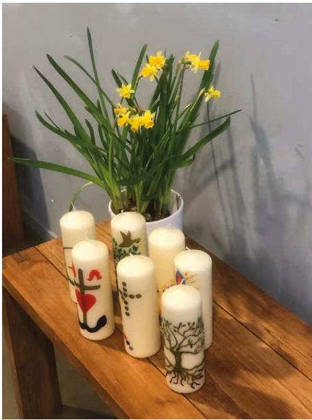
FOTO VAN CORNELINE LANOOPY PAASKAARSEN GEMAAKT DOOR JONG EN OUD IN AANLOOP NAAR PASEN