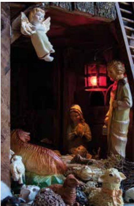
VOORPLAAT: KERSTAL: VREDE OP AARDE, HET KINDJE IN DE KRIBBE; WE ZIJN OP WEG NAAR KERSTMIS.