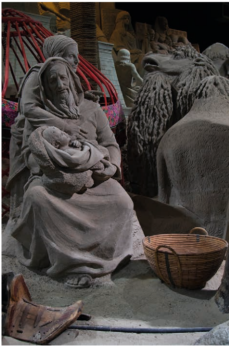
VOORPLAAT: FOTO VAN FRITS ONVLEE ZANDSCUPTUUR GEMAAKT IN ELBURG HTTPS://WWW.ZANDVERHALEN.NL